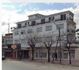
HOTEL LAS VEGAS